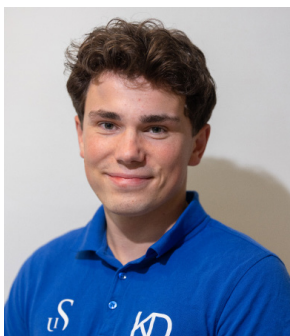
Arrangement Birk Swensen